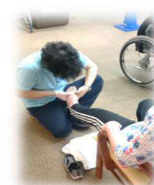
フットチューニング