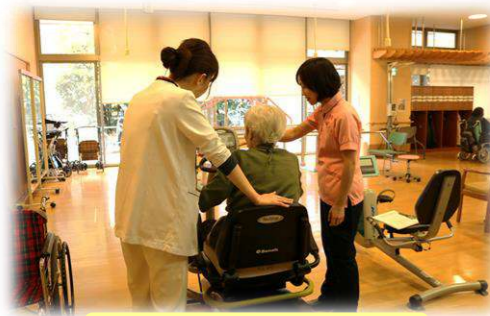
マシントレーニング