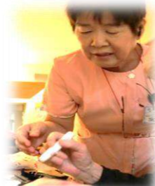
インスリン施注訓練