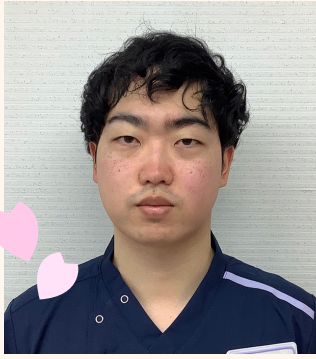
リハビリテーション科 作業療法士