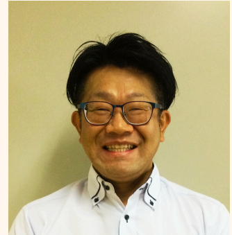
相談課 リーダー ソーシャルワーカー