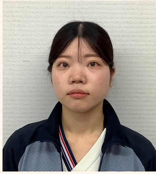
ベルアモールハウス 介護助手