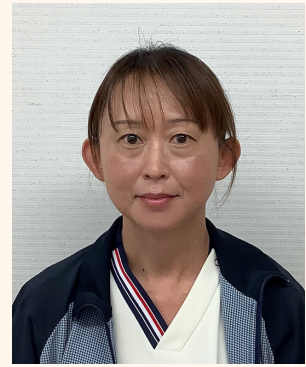
ヘルパーステーション 介護福祉士