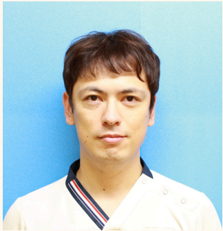
介護課 課長補佐 介護福祉士